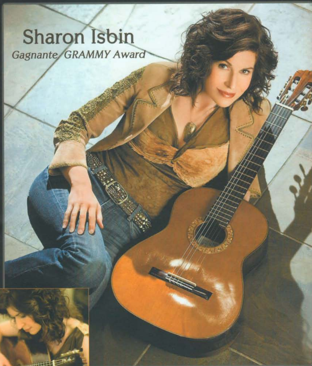
Sharon Isbin Gagnante GRAMMY Award